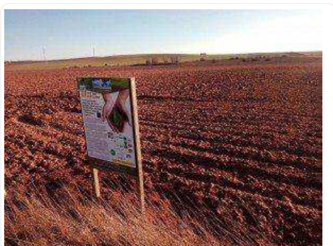
Campo sembrado al que han aplicado el nuevo fertilizante.

La UE, según han expuesto, no dispone de suficientes capacidades de producción para satisfacer la demanda de abonos minerales de los agricultores europeos, por lo que deben importarse de otros países, como Marruecos o Rusia.