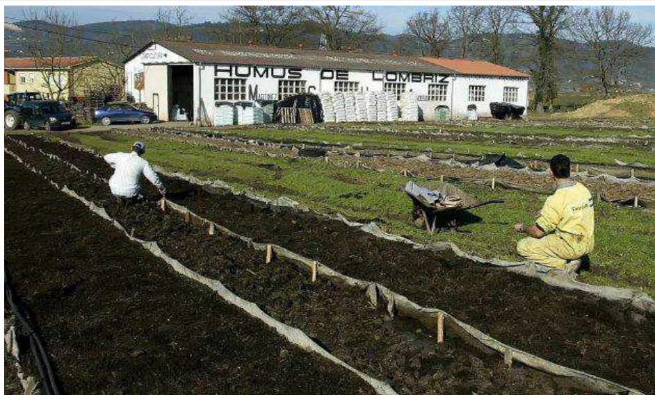
Imagen de archivo de la empresa asturiana Lombriastur que transforma los excrementos en abono orgánico.

Cooperativas Agro-alimentarias y las organizaciones agrarias Asaja, COAG y UPA han pedido la implementación en la Unión Europea (UE) del uso de fertilizantes de calidad y a precios competitivos.