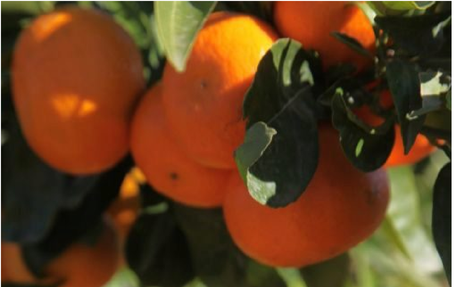
Cultivos de naranjas en una explotación agraria. E. M.

Los productores cítricos prevén afrontar la nueva campaña con un 30% menos de aforo, falta de mano de obra, más incertidumbre internacional y sin ayudas