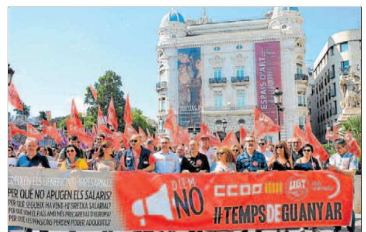
Manifestación a su paso por la plaza de Tetuán, ayer.

Según León, en España se ha recuperado la producción de bienes y servicios respecto a 2008, «hay 36.000 millones de