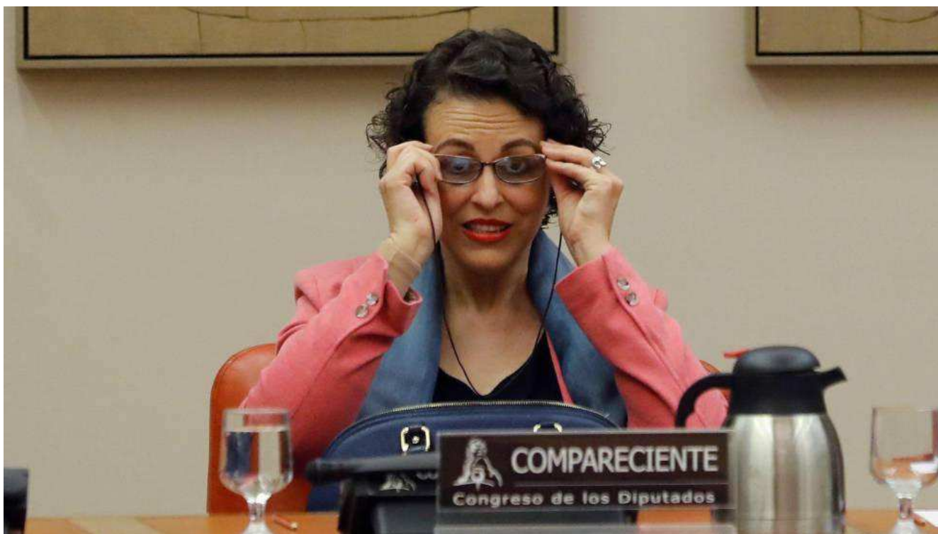
La ministra de Trabajo, Migraciones y Seguridad Social, Magdalena Valerio

El Gobierno sabe que no tiene fuerza parlamentaria para derogar toda la reforma laboral , pero sí que parece tenerla para reformar uno de sus pilares básicos: la negociación colectiva. “Hay que rescatar el convenio sectorial”, anunció este martes la ministra de Trabajo, Magdalena Valerio, lo que los situaría por encima de los convenios de empresa. Esto se traduce en un reequilibrio del poder de negociación hacia patronal y sindicatos, más fuertes en los sectores.