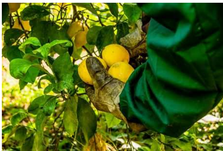
Instantánea de la cosecha de la escasa variedad de Limone Femminello di Siracusa Igp.

"En los primeros días de noviembre, ha comenzado la campaña del limón Primofiore de Siracusa. Este verano no ha sido tan seco como el de 2017, aunque también ha sido seco y ha retrasado el inicio de la temporada actual. Por consiguiente, la floración también se ha retrasado. La consecuencia directa ha sido el inevitable traslado de la cosecha a los primeros días de noviembre. Ya esperábamos menos producción que el año pasado. Por otro lado, gracias al verano de 2018, la calidad del producto es mucho más alta que el año pasado".