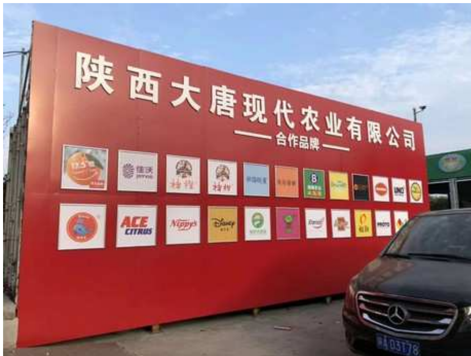
Las marcas de Shaanxi Great Tang Modern Agriculture Co., Ltd.