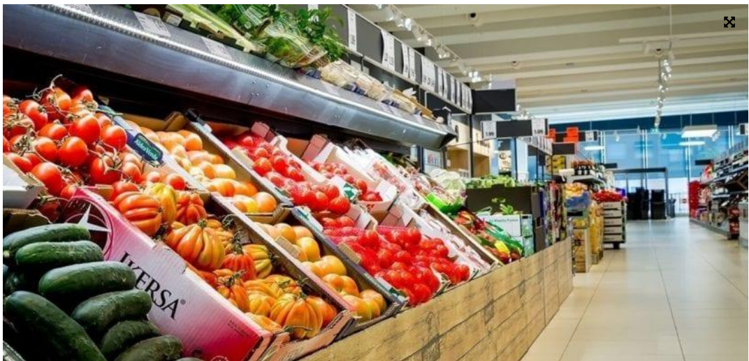
( https://revistamercados.com/wp-content/uploads/2020/07/supermercados.jpg )

espana-608x505.jpg&size=fit&title=Solo+cinco+supermercados+controlan+el+50%+de+la+alimentaci%C3%B3n+en+Espa%C3%B1a)