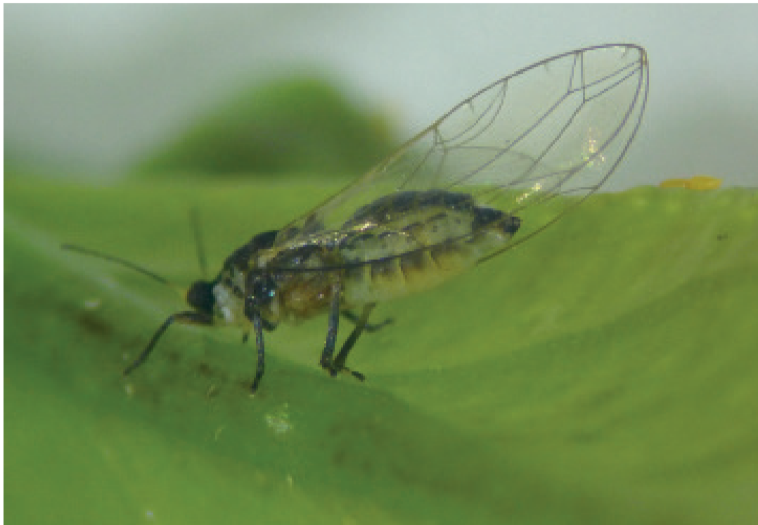
Portugal ha confirmado oficialmente la presencia de Trioza erytreae en una plantación de cítricos en el Algarve.

Partiendo del diagrama de dispersión de los datos de produc-