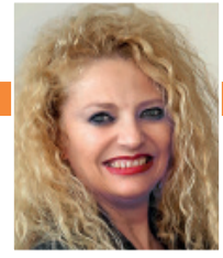
Por INMACULADA SANFELIU (*)

Volviendo a la detección de Trioza en el Algarve portugués, tratándose de un insecto de cuarentena en territorio luso, las autoridades fitosanitarias han procedido inmediatamente a demarcar una zona (zona infestada + zona tampón) que es