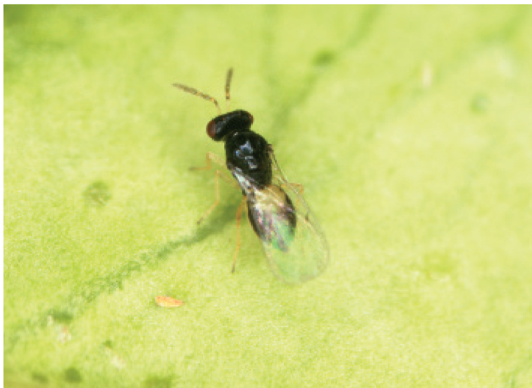
Portugal ha comenzado a liberar en Aljezur el parasitoide Tamarixia dryi para frenar la expansión de la plaga. / CGC

Se debe obligar a que se garantice el transporte a la UE de plantas y productos vegetales sin plagas desde su origen y ello es responsabilidad del ejecutivo